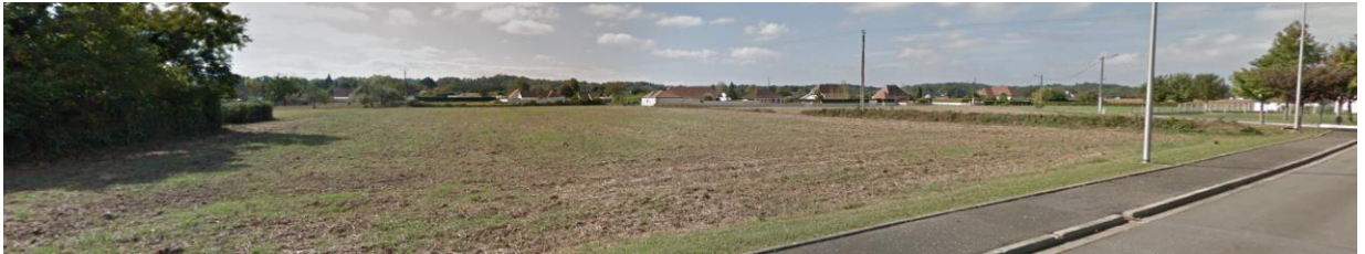
Site perçu à partir de la rue Charle Moureu

La zone 1AU(i) identifie un large îlot agricole valorisé par la céréaliculture et la maïsiculture. La planéité et la superficie du site sont autant de facteurs propices à l'aménagement d'ensemble de ce secteur. Aucun motif végétalisé, linéaire ou ni même ponctuel, ne structure le site en son sein.