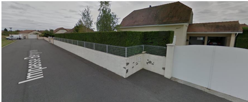
Front bâti impasse Bergeras, en limite de la zone 1AU(i)

La zone 1AU(i) est à moins de 200 mètres de l'église de Pardies. Elle bénéficie en outre d'un positionnement intéressant, non loin de la rue Henry IV et de ses commerces de proximité.