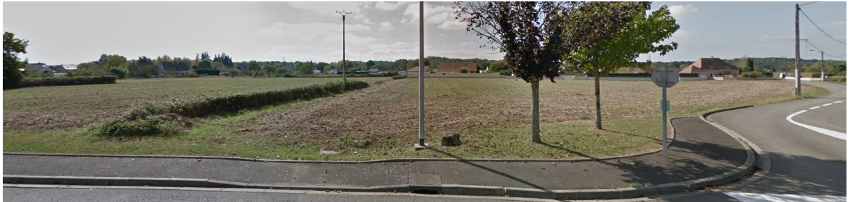
Site perçu depuis le carrefour entre la rue Charles Moureu et le chemin Loungagne