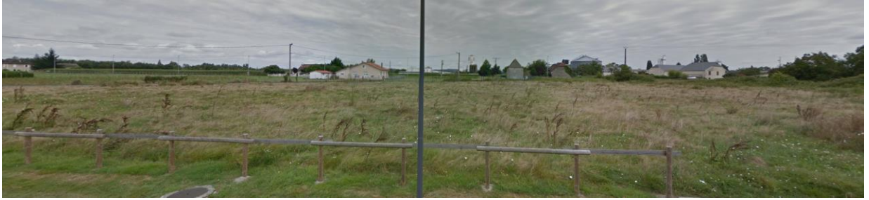
Site perçu depuis l'impasse Bergeras